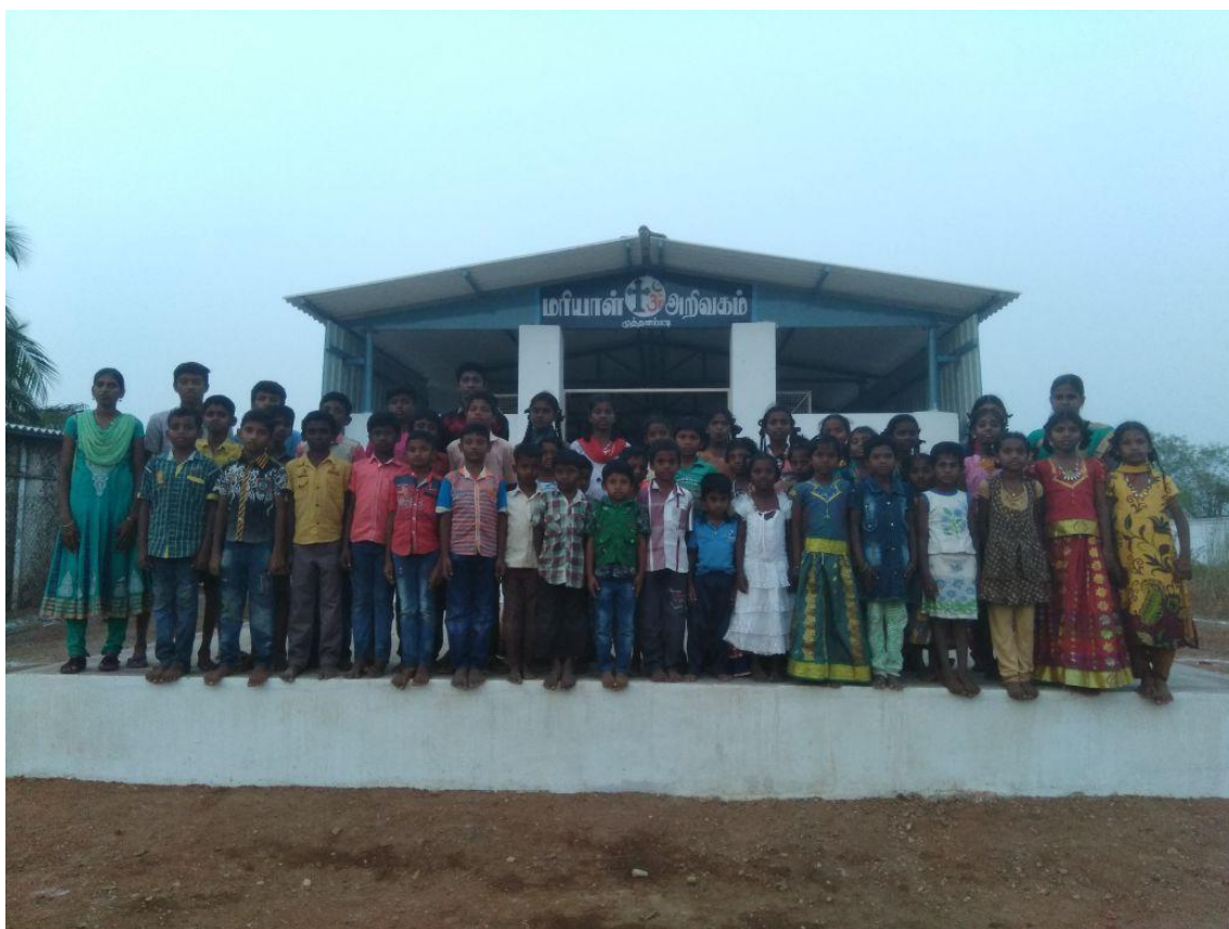
Arivaham a Muthanampatti. Ofereix servei a 42 nens i nenes.

Durant aquest any de pandèmia, els nens i nenes només han anat als arivahams un cop cada setmana o cada quinze dies, per aclarir dubtes de deures del cole i sobretot, per rebre suport emocional. D’aquesta manera s’han sentit acompanyats durant tot aquest temps i creiem que això els ha ajudat a continuar estudiant, encara que amb un ritme més baix del que fan habitualment.